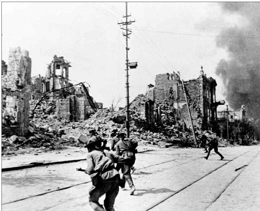
8 месяцев силами морской пехоты, артиллеристов береговой обороны и местных жителей удерживался Севастополь от натиска 200-тысячной ударной армии фашистских войск.