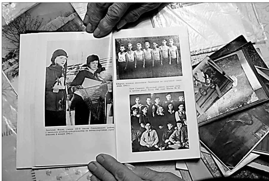
Она дожила до наших дней в том самом доме, где голодная смерть пощадила её в блокаду. И сама показала нам пожелтевшие фотографии и бесценные, бережно хранимые тетради.